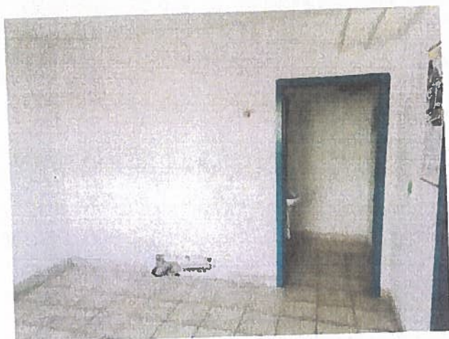
Nebytový priestor – zariadenie predajne