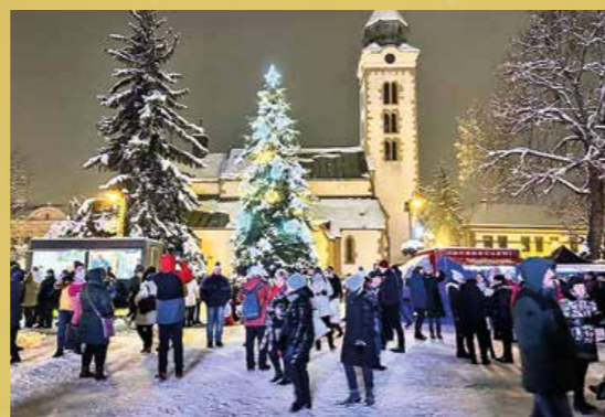
Vianočné trhy rozvonali vareným vínom a vianočnými dobrotami.