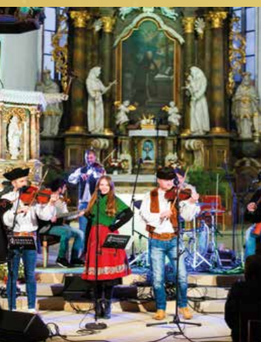
Predadventný koncert v podaní terčovskej kapely Nebeská muzika v gotickom Kostole sv. Petra z Alkantary.