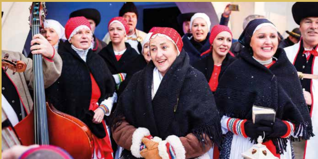
Na Nádvorie Čierneho orla priniesli predvianočnú atmosféru folklórne súbory Váh, Vrbové prútie a Detský folklórny súbor Pramienok.