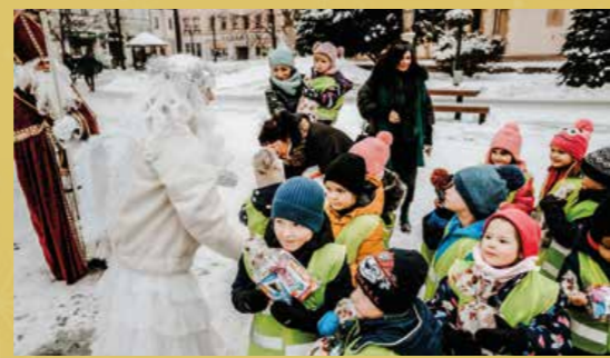
Dva dni sa Mikuláš stretával s deťmi na námestí pri svojom domčeku, kde im spolu s anjelom a čertom rozdával sladké balíčky.