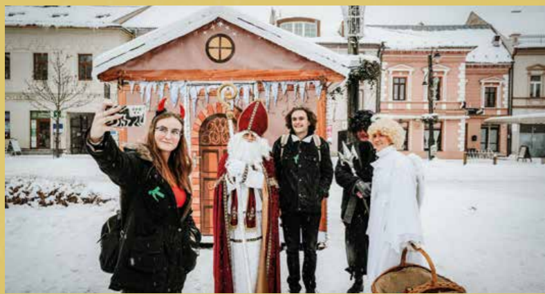
S Mikulášom sa nefotografovali len deti, potešili aj maturantov.