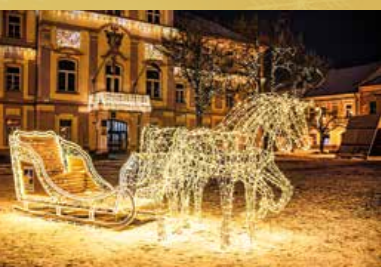
Sviatočnú atmosféru urobila mestská výzdoba, ktorej na námestí dominujú svetelné sane s koňmi.