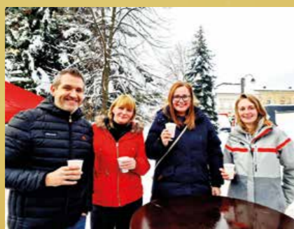
Mikulášsky jarmok bol skvelou príležitosťou aj na firemné punče.