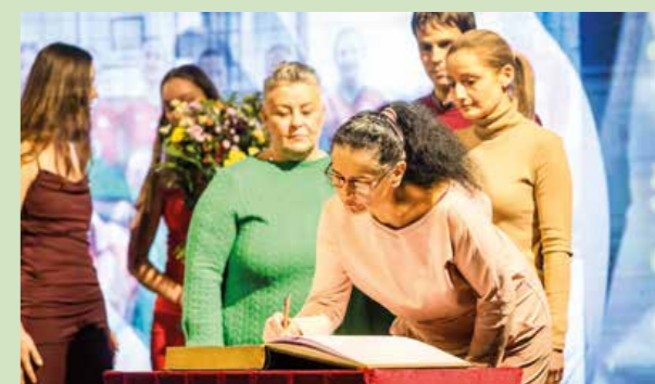
Kolektívne športy do 18 rokov - Volejbalový klub Rachmaninka Liptovský Mikuláš, staršie žiačky.